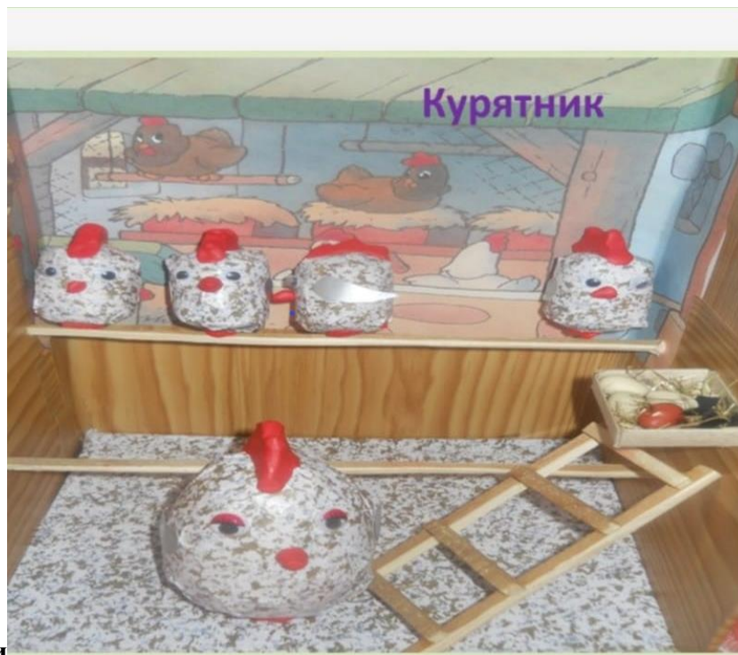
Домик для курочки

Макет курятника поможет воспитателю рассказать о том, как человек заботится о курах, строит для них специальные домики.