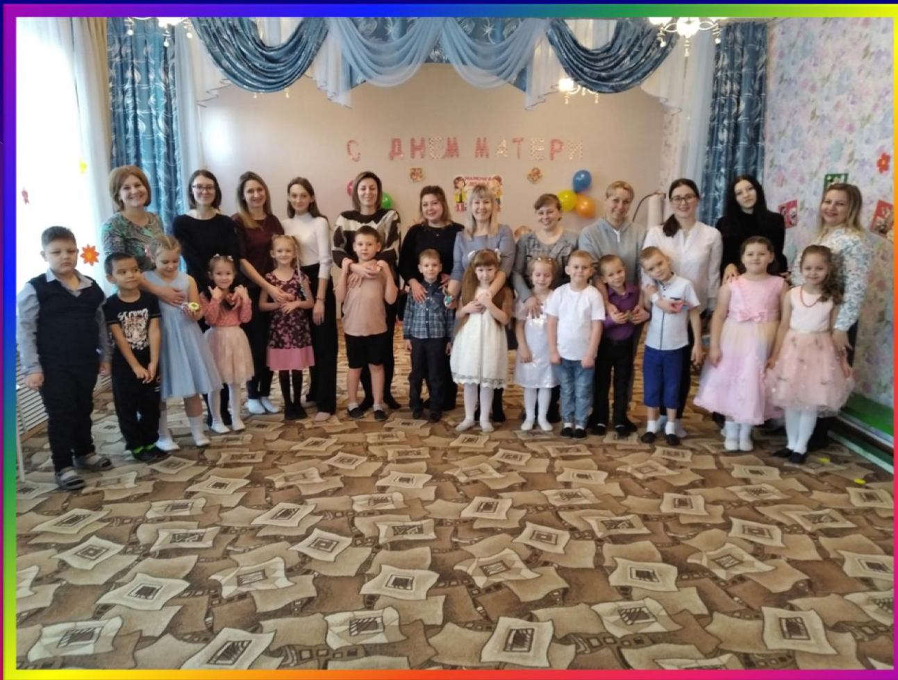
Праздник «День матери»